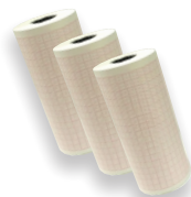
3 rolos de papel termossensível