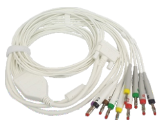
Cabo paciente tipo banana 10 vias