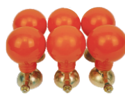
Kit eletrodo tipo pera