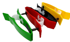
Kit cardioclip adulto